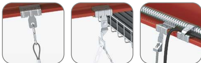
Универсальный балочный зажим