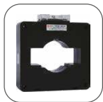
Возможность настройки под любой трансформатор тока