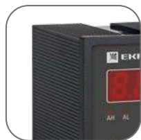
Корпус изготовлен из не поддерживающей горение пластмассы