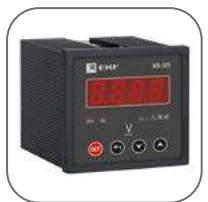
Длительная работа без калибровки