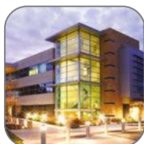
Различные объекты строительства и инфраструктуры