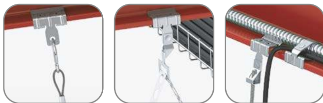
Универсальный балочный зажим